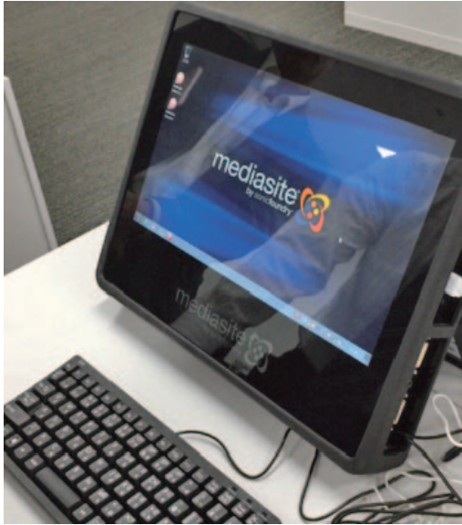
図2 Mediasite Recorder