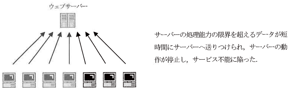
図1) ウェブサーバー攻撃の概略図

サイバーデモとは、インターネット上で主張を同じくする賛同者が多数参加して、政治的な目的を実現するための統一行動を行い、特定のウェブサイトなどに対して不正アクセスなどを行うものと解されている。日本においては2001年に歴史教科書問題が起きた際に最初のサイバーデモが発生した。新しい歴史教科書を作る会によって作成された教科書が公表されると、2000年から2001年にかけて日本を含むアジア諸国で社会問題となった。これが首相の靖国神社参拝とあいまって中国・韓国などの近隣諸国と深刻な外交問題に発展していた。これら日本の歴史教科書問題に関する抗議活動として2001年3月、文部科学省、自由民主党、産経新聞社など合計6ヶ所のウェブサイトが中国や韓国などから攻撃された。この事件では極めて多数の賛同者が、予め定められた時刻に攻撃対象のサーバーに対し同時にアクセスを行う攻撃が行われ、サーバーの処理能力を超える過大な負荷により、ウェブサイトが提供する正常なサービスを停止させるなどの被害を与えた(図1)。